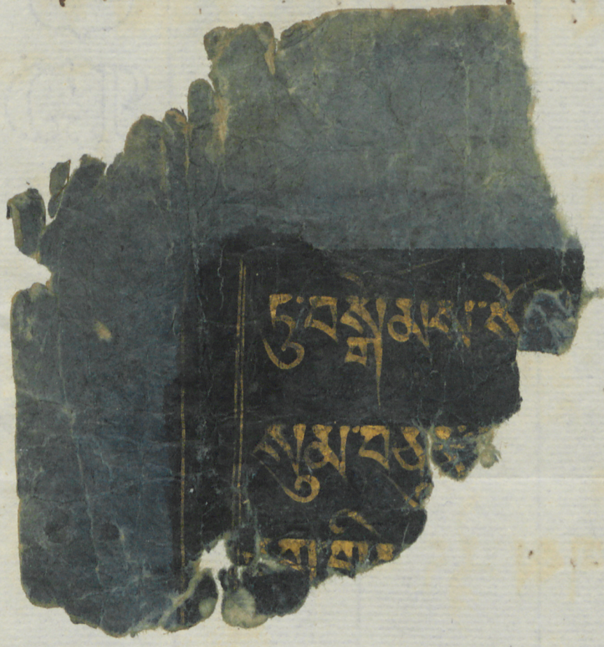
Specimen scripturae Tanguticae seu Mun- galicae litteris aureis in charta caerulea nigro colore obducta (ubi litterae scriptae erant) exaratum in utraque pagina. Longitudo 1 1/4 Ulnae. Ocho lineis in utroque latere scriptura absolubatur. Latitudo quadrag. cum semisse.