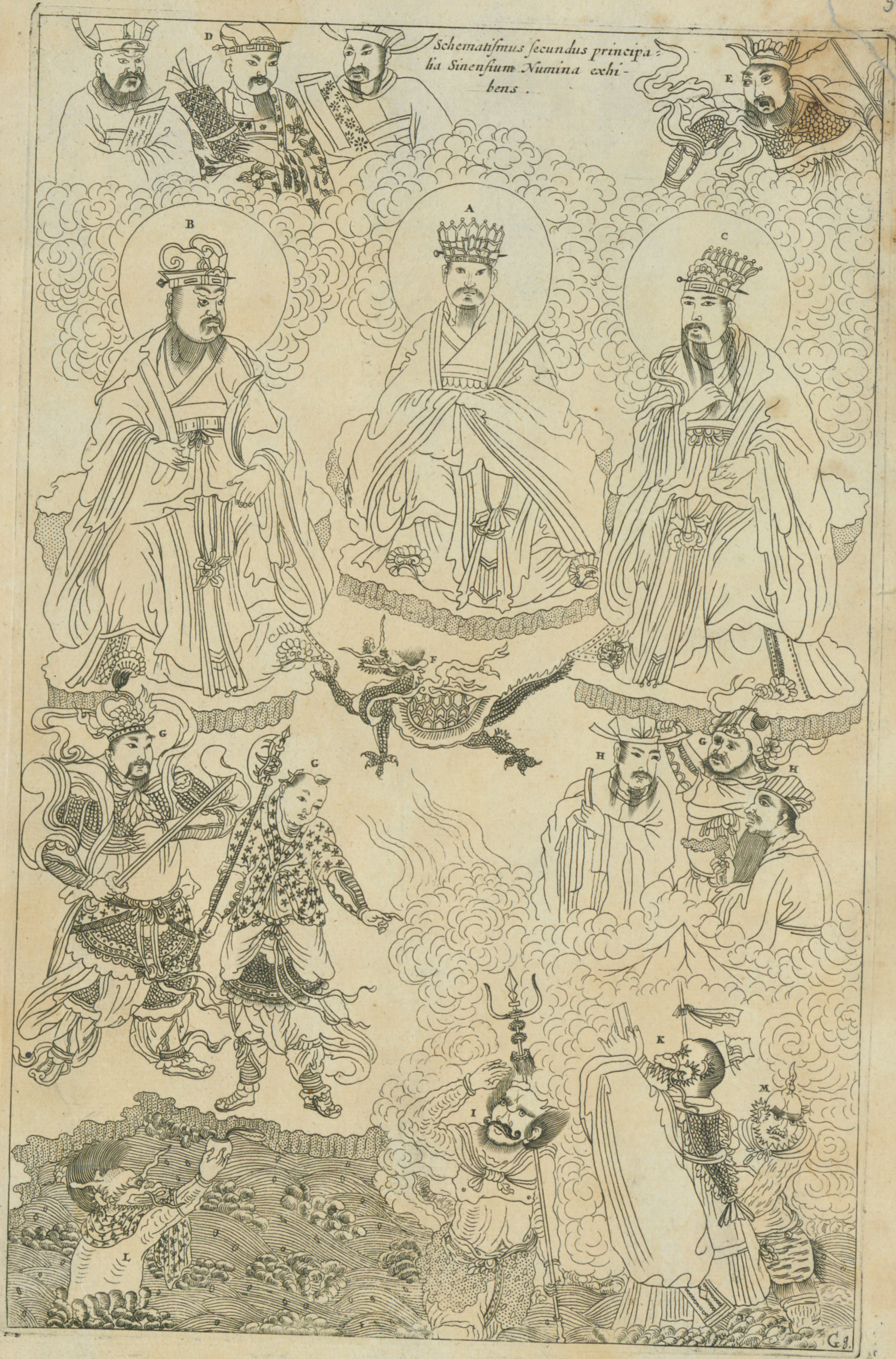
Schematismus secundus principa- lia Sinenfium Numina exhi- bens .