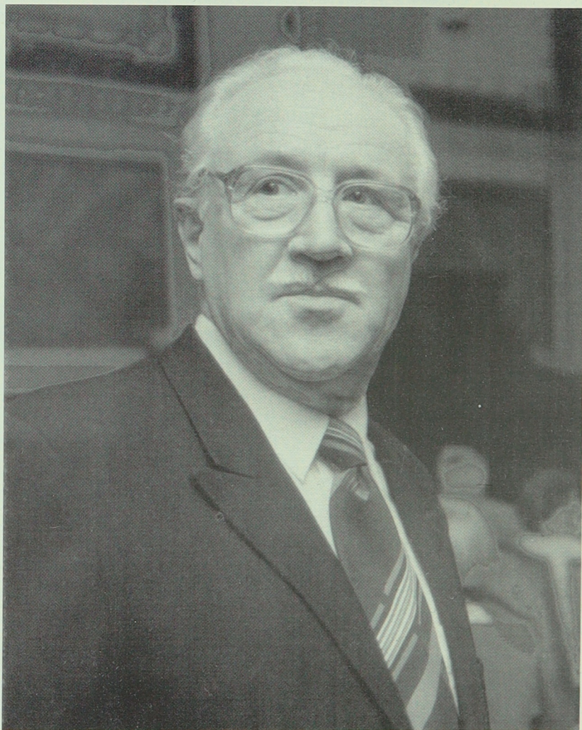
Der Jubilar am 9. April 2001