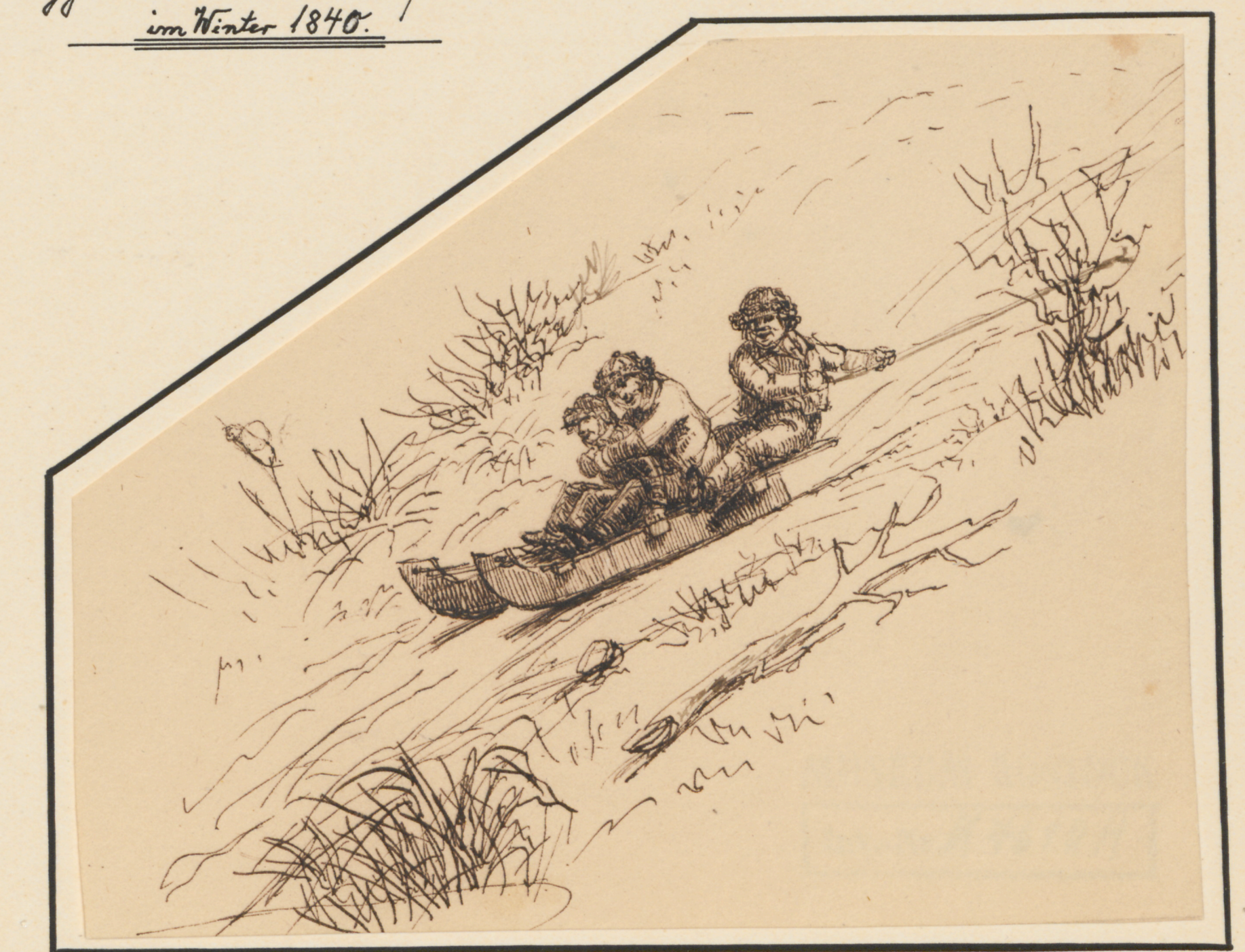
Winterskuden der Kinder "Die Schlittenfahrt" um 1835.