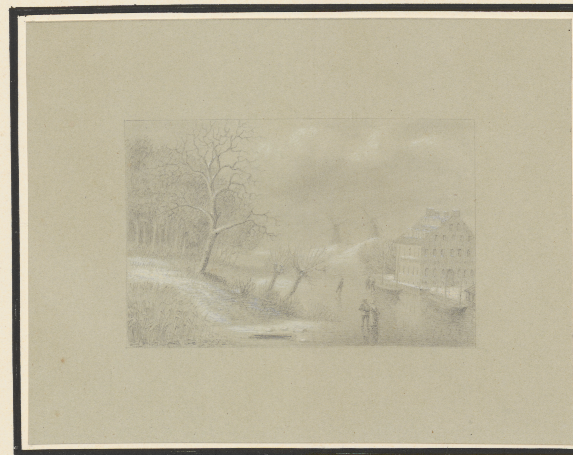
Winterlandschaft mit Eisbahn.