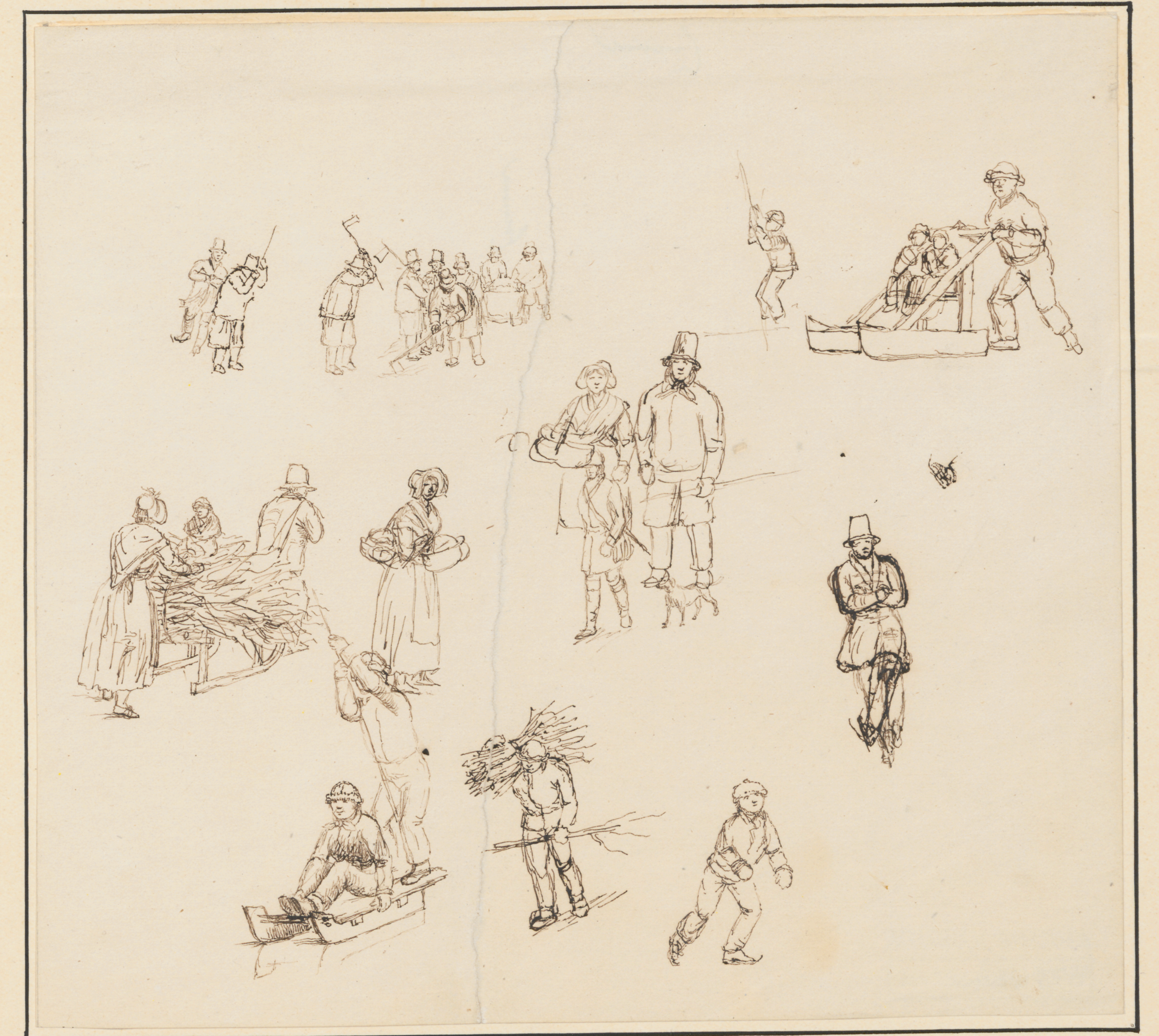
Keine Pflügen über Wolkes auf der Harmer im Winter 1840.