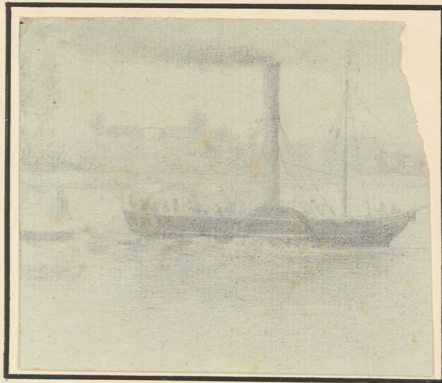
Passagierdampfer "Stadt Rostock" auf der Fahrt nach Hamemünde 1834.

Zeichnung nach der Natur gezeichnet von Stadtphysikus Dr. med. Joh. Friedr. Wilhelm Lunburg zu Rostock. Die Stadt Rostock ist im Hintergrunde schwach erkennbar aber stand der Zeichner am Schiffsdeck.