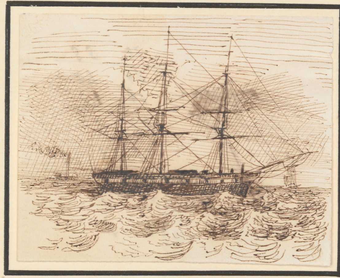
Seine Bark vor Hamemünde. 1847.