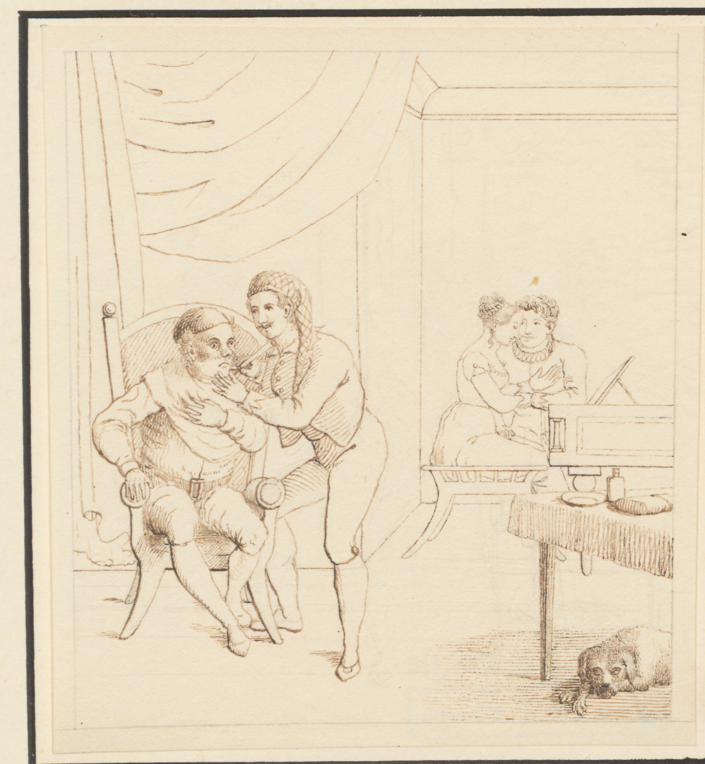
Der argwöhnische Ehemann.