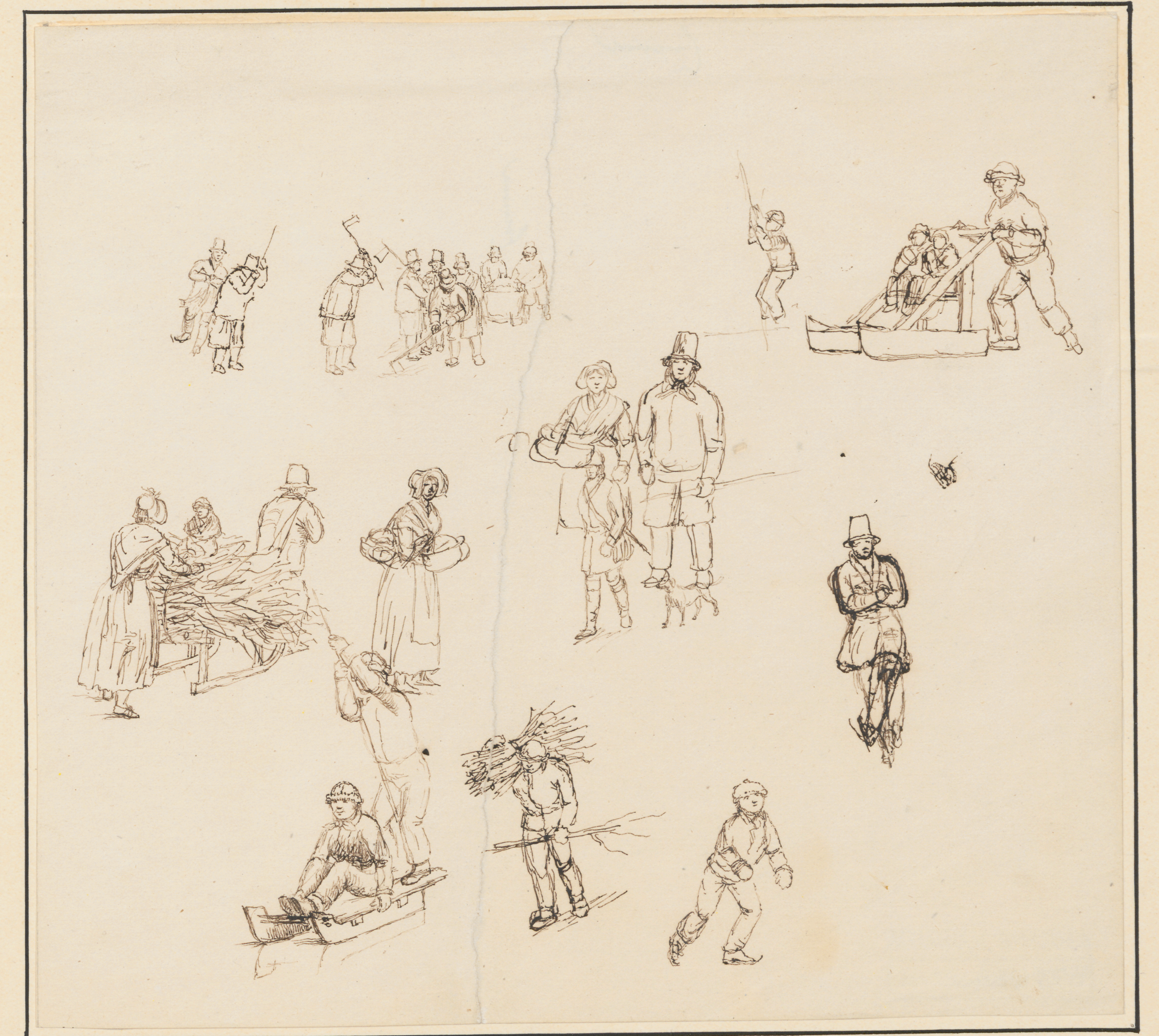
Neine Pizzen über Brettes auf der Harmon- im Winter 1840.