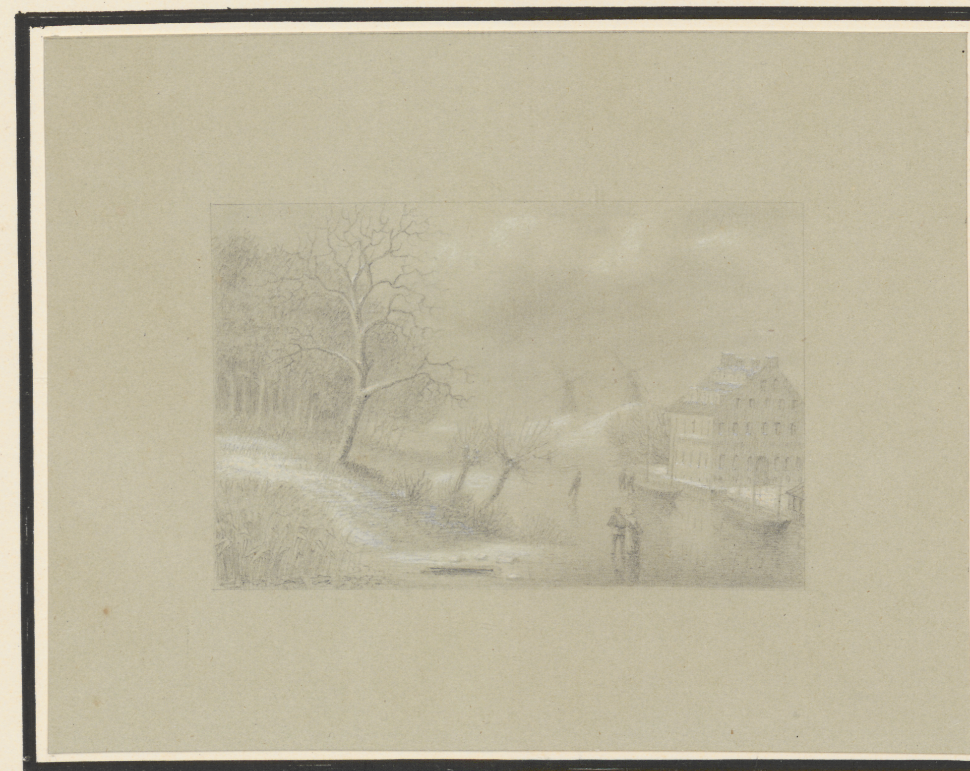
Winterlandschaft mit Eisbahn.