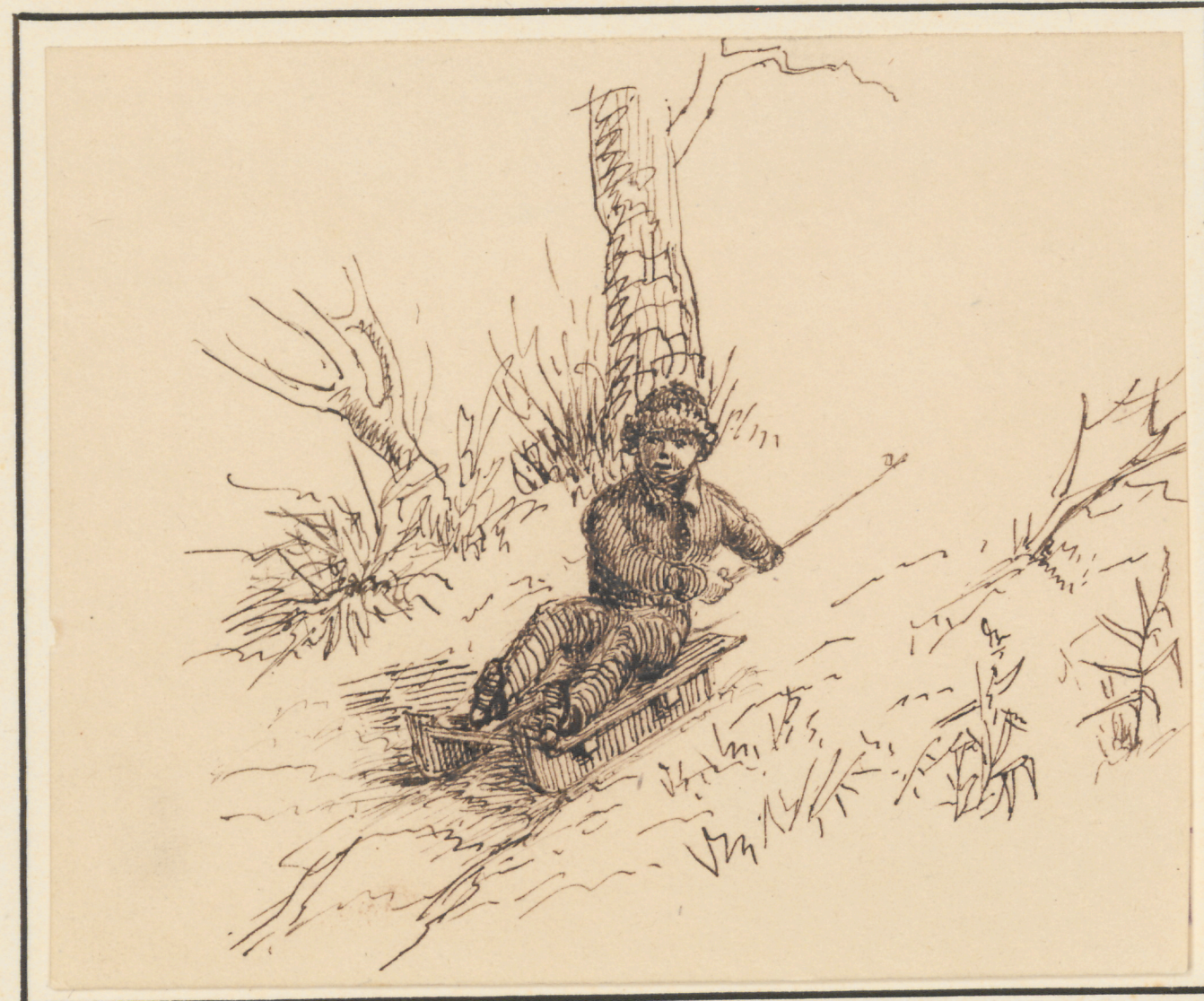
Die Schlittenfahrt. 1835.