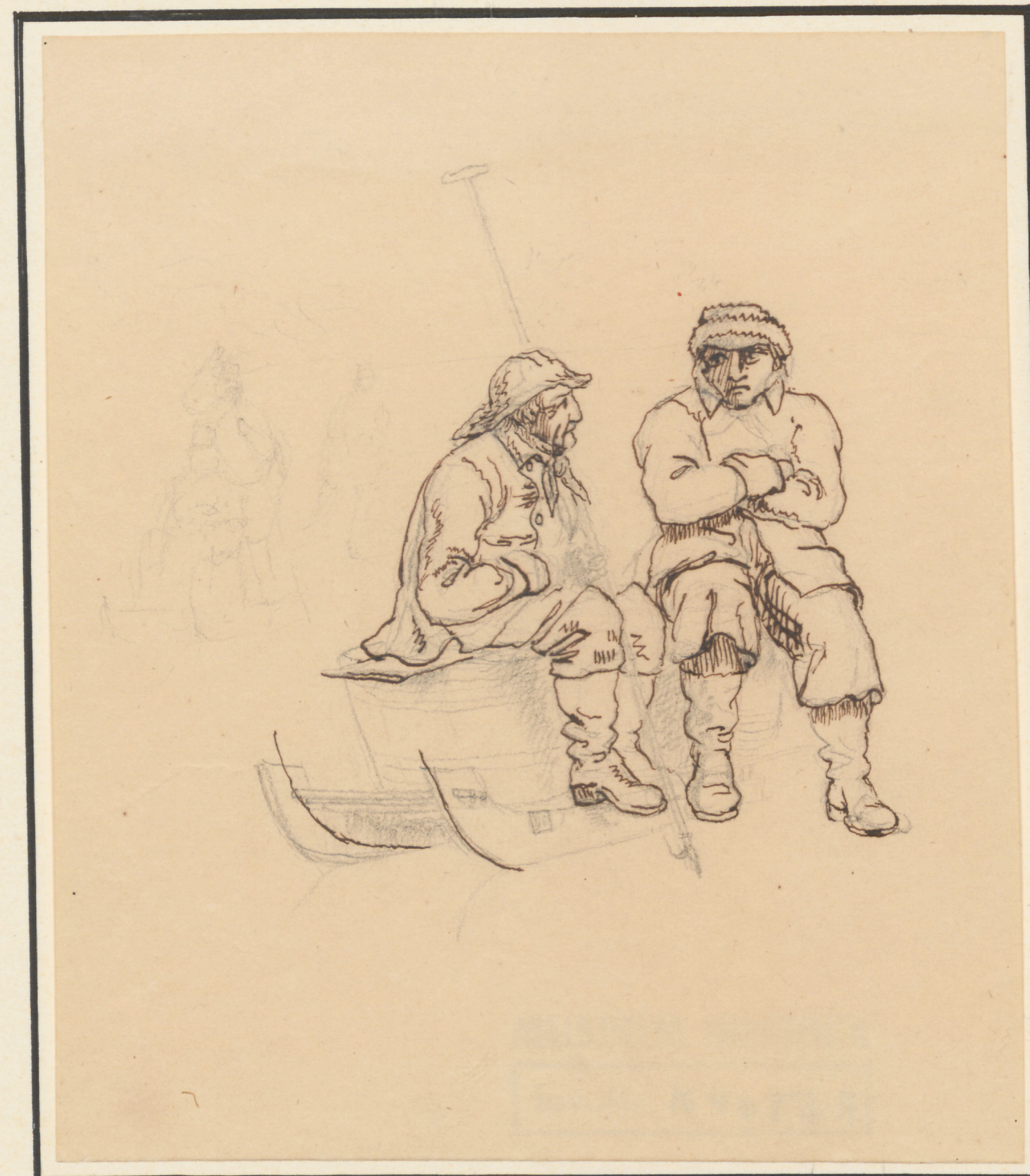
Höcker auf dem Eise.