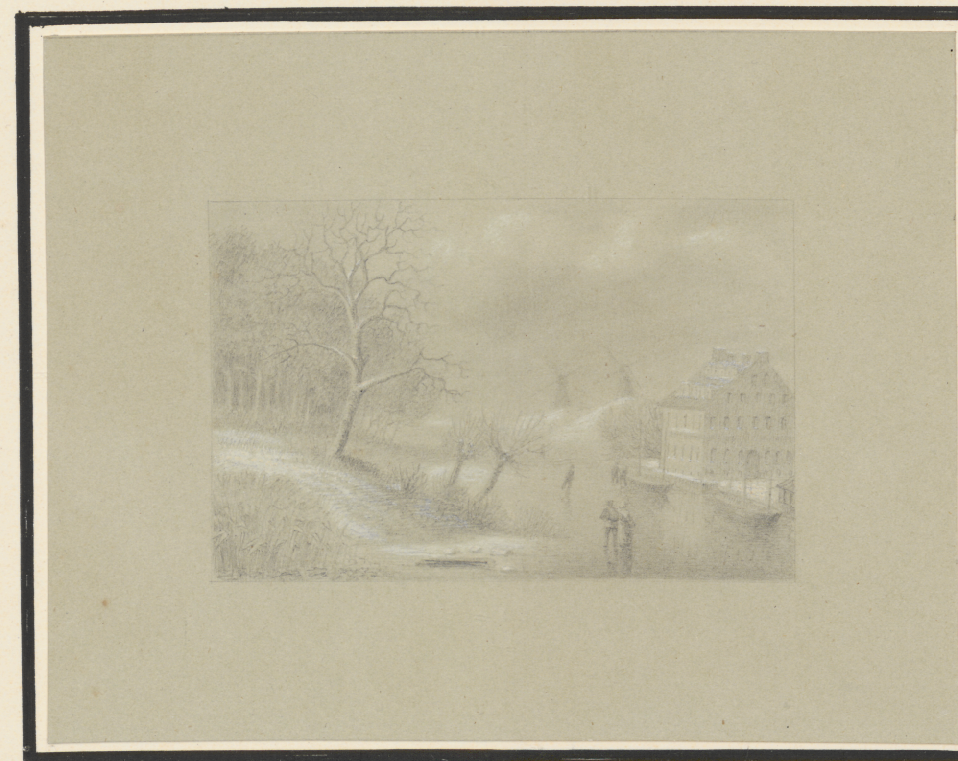
Winterlandschaft mit Schlitten.