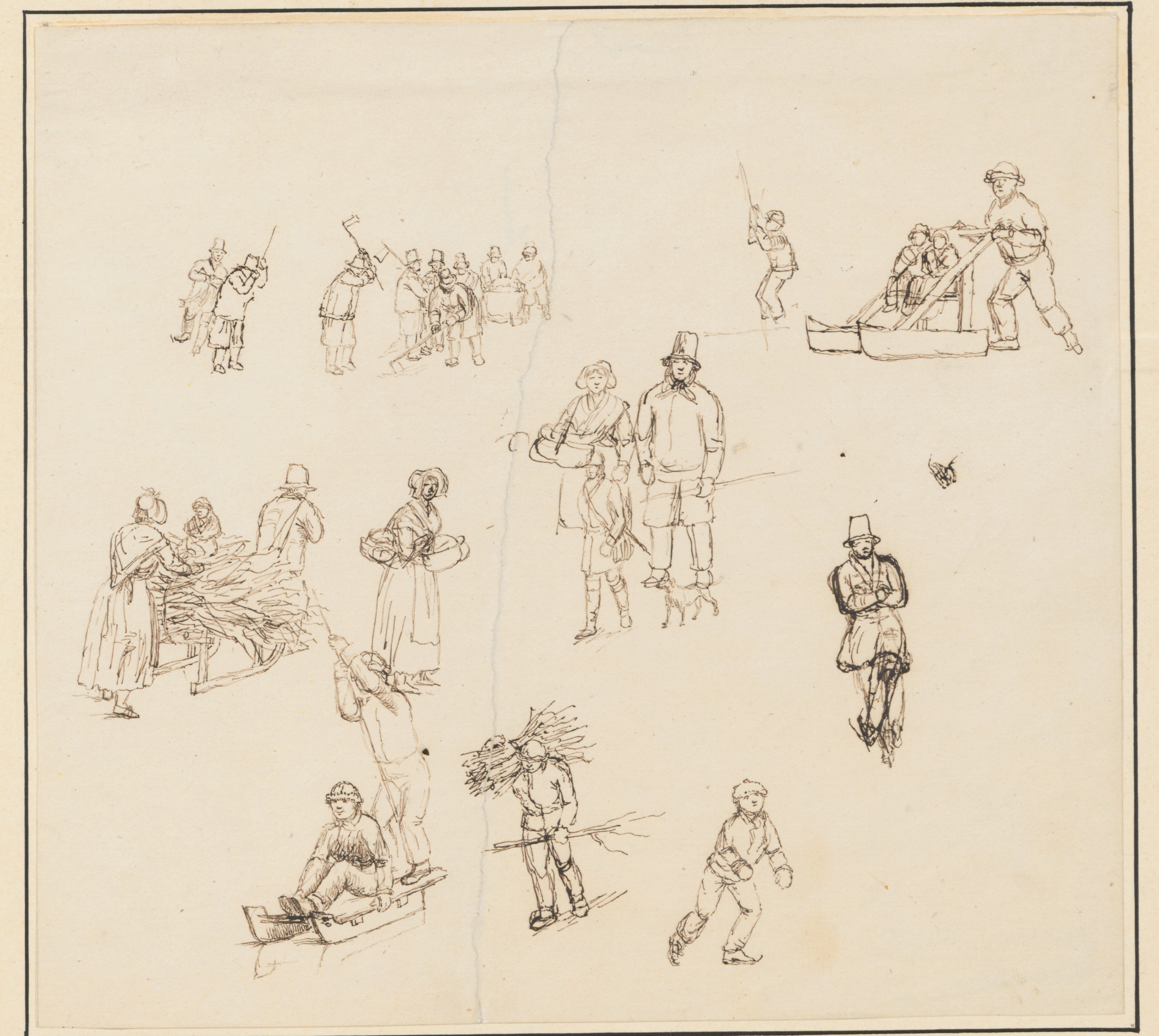
Meine Pflügen über Wolkes auf der Harmer im Winter 1840.