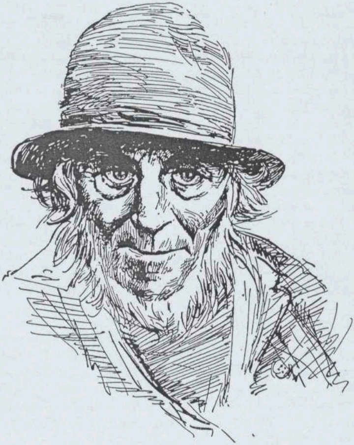
Kuhfütterer Anders aus Körkwitz (nach einem Ölbild v. Egon Tschirch, Rostock)