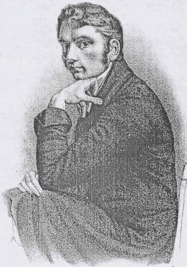
Philipp Otto Runge