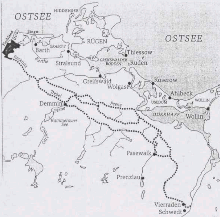
Prinzipiskizze des nordwestlichen Oderabflusses (fett eingezeichnet) bis zur Mitte des 12. Jahrhunderts (nach Goldmann/Wermusch)

der Journalist Günter Wermusch aufgestellt, die einen alten Flussverlauf der Oder zwischen Schwedt und dem Barther Bodden rekonstruieren und glauben, dass die Reste des von ihnen dort vermuteten Vineta seit der seinerzeit verheerenden Sturmflut am Grunde dieses Boddens ruhen. 120 – Letztendlich haftet aber allen Versuchen, das Vineta-Rätsel zu lösen, etwas Hypothetisches an, solange nicht Unterwasserarchäologen überzeugende Zeugnisse der verschollenen Stadt zutage fördern.