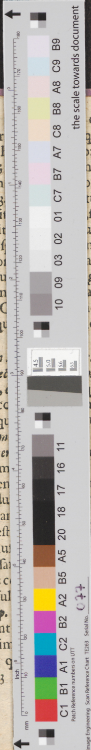
Image Engineering Scan Reference Chart TE263 Serial No. 077

de quæ pro nito oxi tum sint am nda ate ge ate em en . 13. te, quia titu uld ob itũ; na ra nũ: quid no pe um mi per um om ter nita ait,