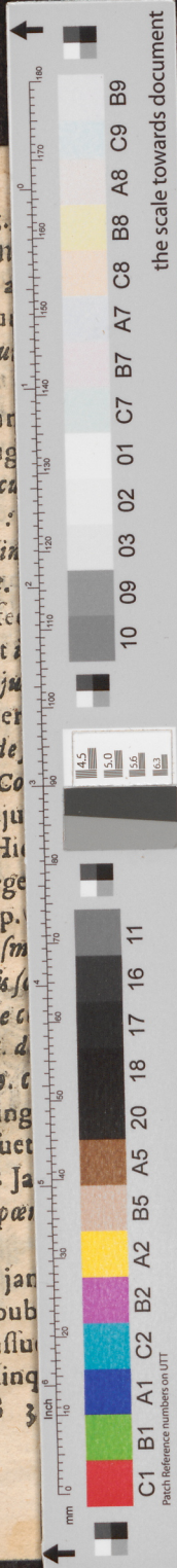
Image Engineering Scan Reference Chart T263 Serial No. Patch Reference numbers on UTT