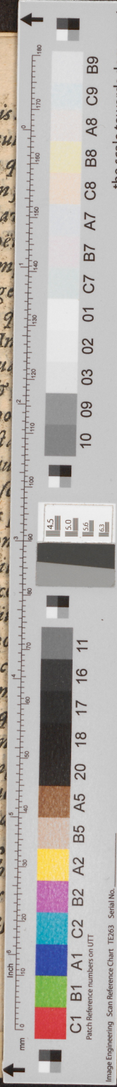
Image Engineering Scan Reference Chart TE263 Serial No.

vibi fronte, is velle ducat? rum) me dicas, exoptas, enti, lucem. xii strictus. sco, ulgi Iumen. s, luevit udis. m Musis bo. cit. illi-