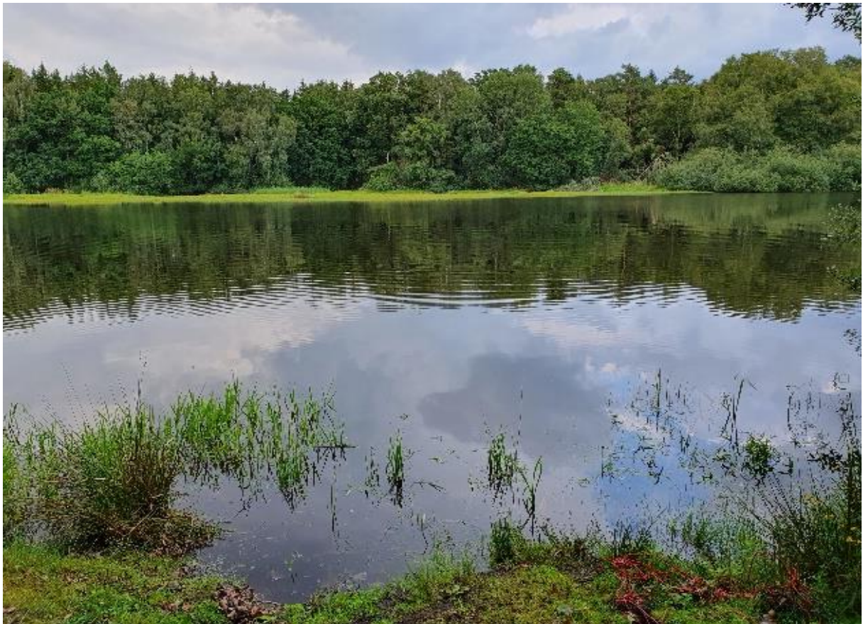
Abb. 2 Wuchsgewässer von Chara braunii (Teich 25; Foto: A. Schacherer).