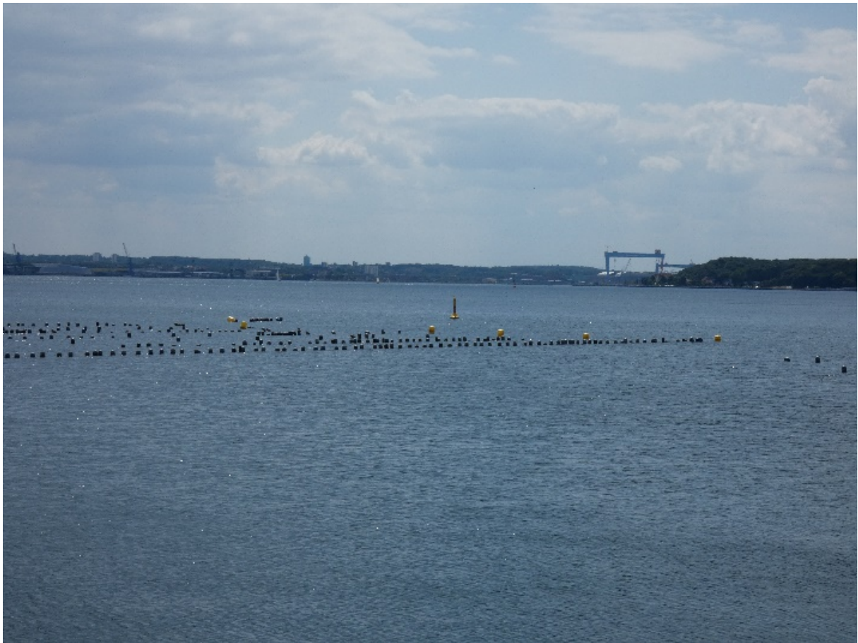
Abb. 2: Miesmuschelkultur in der Kieler Förde.

Die Darstellung der geernteten Mengen an der schleswig-holsteinischen Ostseeküste (Abb. 1 oben) spiegelt die ökologischen Bedingungen der vergangenen Jahre wider. Die Auswertung von statistischen Quellen, sofern vorhanden, erweist sich hier als eine der einfachsten ökologischen Bewertungsmethoden. Die Schwankungen der Erntemengen im Laufe der Jahre gehen mit Eutrophierung, Verschlammung, Sauerstoffmangel und Verödung der Habitate sowie dem daraus resultierenden Muschelsterben Hand in Hand. Die Nutzung der Miesmuscheln an der Ostsee nach dem 2. Weltkrieg ist primär als Versorgungsleistung zu sehen. In heutiger Zeit werden die Wildmiesmuschelfischerei in der Flensburger Förde sowie die Hängekultur in der Kieler Förde nur noch von zwei Betrieben durchgeführt. Aktuelle Daten zur Erntemenge werden daher in den offiziell veröffentlichten Statistiken geheim gehalten und stehen somit für eine Bewertung nicht mehr zur Verfügung. Dies ist ein generelles Problem in der Verwendung von Statistiken für die Bewertung von Ökosystemleistungen: wenige relevante Statistiken liegen durchgängig für einen längeren Zeitraum mit der gleichen Erhebungsmethodik vor. Oft ändern sich Definitionen und der räumliche Bezug (z. B. Neuordnung von Landkreisen und Gemeinden), so dass eine genaue Interpretation der Analyse für das Ableiten von Managementzielen dringend nötig ist.