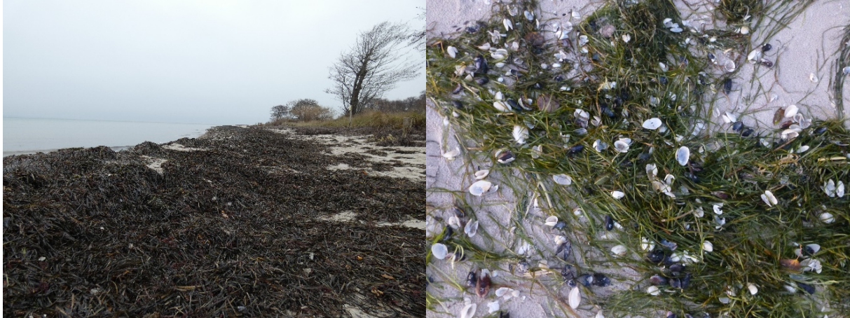
Abb. 3: Treibsel am Strand.