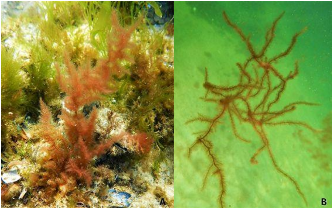
Abb. 3 Dasya baillouviana bei Südmole des Yachthafens „Hohe Düne“: festwachsende (A) und freitreibende Individuen (B).