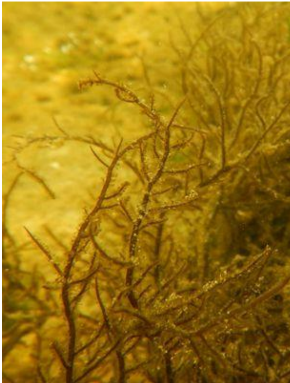
Abb. 4 Gracilaria vermiculophylla bei Pagenwerder (Breitling)

Im Zuge der Videountersuchungen im Juli 2017 wurde ein ausgedehnter Bestand dieser Art bei der Insel Pagenwerder (Gebiet B, Abb. 1) angetroffen. Der Bestand erstreckt sich entlang der ganzen östlichen Seite der Insel in einem Tiefenbereich von 1,3 – 2,3 m Tiefe. An der Schutzsteinmole der Insel ist die Alge bereits ab 0,5 m Tiefe in einzelnen Exemplaren zu finden; größere Matten von 1,0 – 2,0 m Durchmesser treten aber erst ab ca. 1,5 m Tiefe auf.