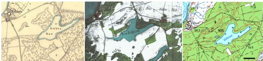
Abb. 3 Entwicklung des Wald-Bestandes im Umfeld des Gülzsee (GÜL) basierend auf historischen und aktuellen Karten. links: Wiebeking'sche Karte (1786), mitte: preußische Karte (1888), rechts: aktuelle topographische Karte ('Amt für Geoinformation, Vermessungs- und Katasterwesen', Mecklenburg-Vorpommern; Maßstab = 500 m).

Hier ergibt sich ein wichtiger Unterschied zu den Ergebnissen an 22 norddeutschen Seen, wonach das Hochmittelalter für große Gebiete des norddeutschen und zentraleuropäischen Flachlandes der nächstwichtigste Zeitraum für Veränderungen in der Landnutzung, verbunden mit negativen Einflüssen auf Seen und Fließgewässer, darstellt. In dem Gebiet nördlich und östlich der Elbe wurden ein Großteil der Städte, Kirchen und Klöster zwischen 1150 und 1450 AD erbaut. Dies war verbunden mit massiven und großflächigen Rodungsereignissen sowie Eingriffen in das hydrologische System (Anlage von Mühlenwehren, Fischzuchtanlagen etc.), was für das norddeutsche Flachland vielfach dokumentiert wurde. Ohle (1973, 1979) weist nach, dass Veränderungen des Seespiegelniveaus des Großen Plöner Sees um ca. 2 m im Jahr 1256 AD massive, bis in die Gegenwart andauernde Eutrophierungen zur Folge hatten. Vergleichbare Eutrophierungsursachen ergeben sich z.B. für Seespiegelerhöhungen am Krakower Obersee (HÜBENER & DÖRFLER 2004), die Müritz (LAMPE et al. 2009) und den Großen Eutiner See (WIECKOSKA et al. 2012).