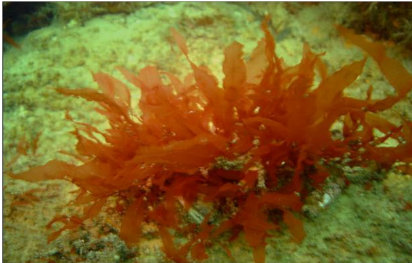
Abb. 1. Delesseria sanguinea in der Mecklenburger Bucht (Ostsee).

solchen aus Algen, körpereigene Prozesse beeinflussen und so die Gesundheit fördern, Krankheiten vorbeugen bzw. deren Heilung unterstützen kann. Den Resultaten der ersten Tests zufolge verfügen die sulfatierten Polysaccharide von Delesseria sanguinea in der Tat über ein günstiges Wirkprofil: Sie hemmen einige Mechanismen der komplexen Entzündungsreaktion deutlich stärker als handelsübliche Arzneimittel (z.B. Heparin) und zeigen sogar darüber hinaus eine leicht gerinnungshemmende Wirkung (Alban & Schygula, 2006). Ferner werden Algen als Rohstoffquelle für die Gewinnung außerordentlich wichtiger technologischer Hilfsstoffe wie Carrageenane, Alginsäure und Agar verwendet. Bemerkenswert ist auch die wachsende Beliebtheit von Produkten auf Algenbasis im Bereich der Nahrungsergänzungsmittel und Kosmetik („Wellnessindustrie“).