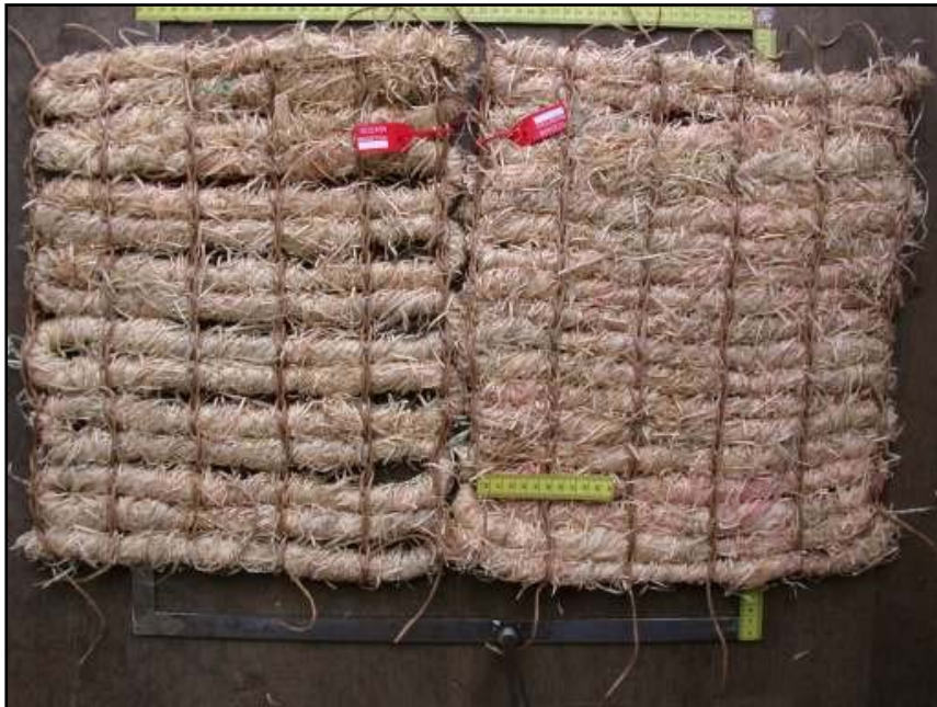
Abb. 1 Probemuster der textilen Vegetationsträger aus Holzwolle (maschenbildendes Grundfadensystem Papier- und Hanffaden). Links die gitterartige, rechts die lichtdichte Variante.

Als verrottbarer Vegetationsträger wurde ein grobes Kettengewirke mit Holzwolle-Seil (Fichte, Durchmesser ca. 20 mm) als Schussmaterial eingesetzt. Für das Grundfadensystem wurde Papierfaden (2 mm, 3.111 \text{ tex} = \text{g km}^{-1} ), verstärkt durch Hanfgarn ( \text{Nm } 0,45 = \text{m g}^{-1} ) verwendet. Der Vegetationsträger wurde in 2 Varianten hergestellt: als gitterartige Variante mit Rechteckmaschen von etwa 20 \times 50 \text{ mm} (aussetzender Umkehrschuss; Raport 1/0/0), die eine Belüftung des Bodens zulässt mit 38 Schuss/m und einer Flächenmasse von 3.300 \text{ g m}^{-2} und als lichtdichte Matte (zur Bestandssteuerung) mit 55 Schuss/m (Vollschuss) und einer Flächenmasse von 4.500 \text{ g m}^{-2} (Abb. 1). Die Aufmachung war 5 \times 1 \text{ m} \times 1 \text{ m} (gitterartig) bzw. 2 \times 1 \text{ m} \times 3 \text{ m} (lichtdicht). Die Wirkversuche fanden auf einer Rechts-Rechts Kettenwirkmaschine (GWM1200, Fa. Müller, Frick/CH) mit extrem groben Nadeln statt.