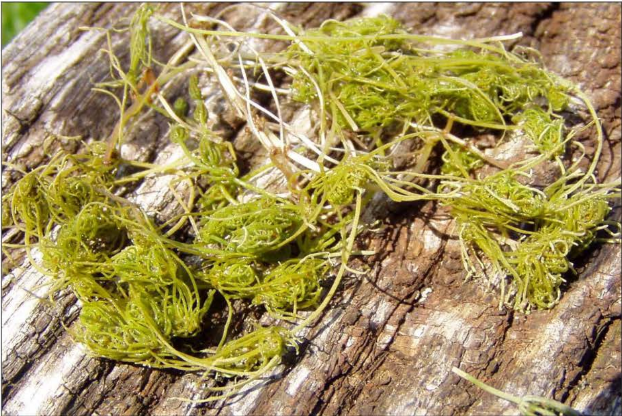
Abb. 3 Tolypella glomerata , Fundort: Triboltingen Juli 2004