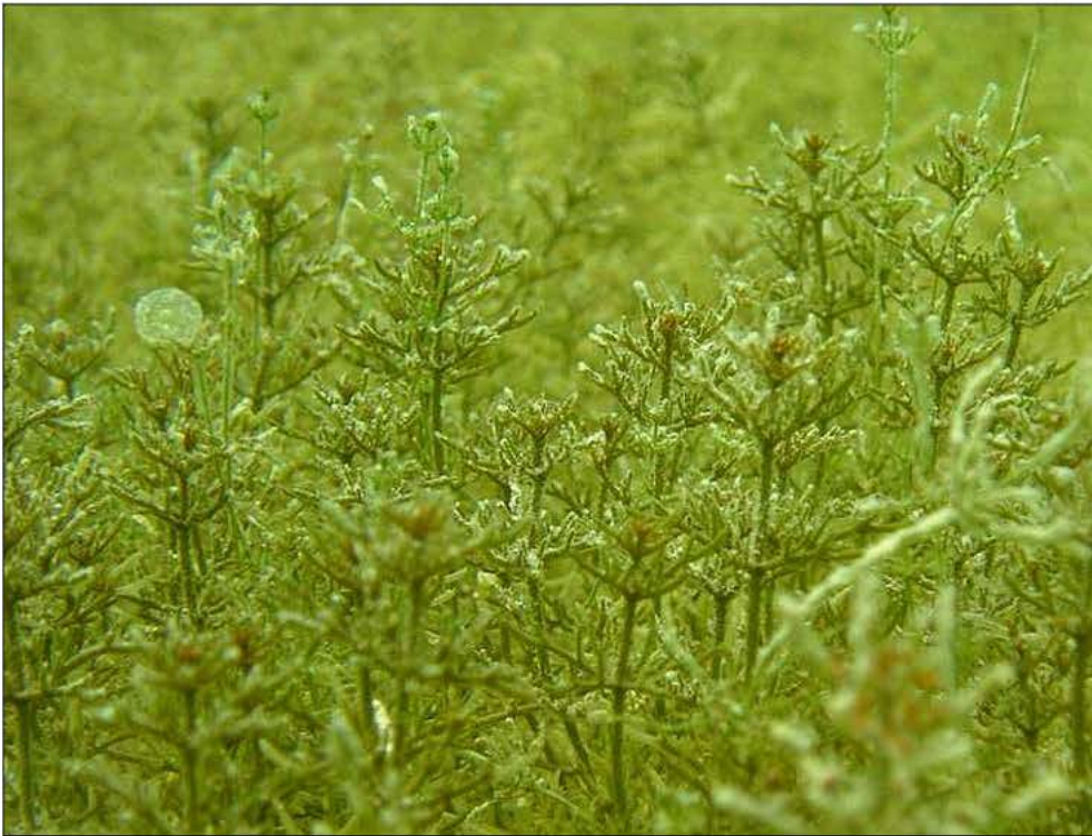
Abb. 2 C. tomentosa in der Bauernhornbucht am Nordufer der Insel Reichenau im Sommer 2003

Die Autoren nennen auch weitere Quellen für diesen Brauch, die bis ins Jahr 1784 zurückreichen. „...Dadurch wird der See und der Rhein gereinigt und das Bett immer offen gehalten (SANDERS 1784 zitiert in LEINER 1892, in SCHRÖTER UND KIRCHNER 1902). „Mit Chara gedüngter Boden soll viel weniger „Ungeziefer ziehen“. Den Mäusen sei der Geruch widerwärtig. Das Volk nennt diese düngfähige Chara allgemein „Mieß“ (LEINER 1892, zitiert in SCHRÖTER & KIRCHNER 1902).