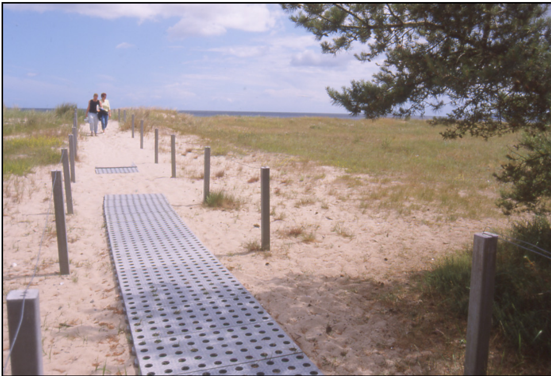
Abb. 2: Zugang „Mukran Neu“, die Befestigung des Weges und die Neugestaltung des Zaunes könnte in Zukunft die Trittschäden minimieren