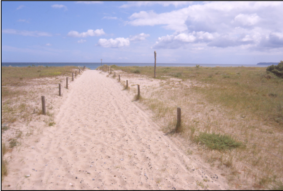
Abb. 1: Übergang „Mukran – Alt“, der niedrige Zaun und das NSG-Schild (rechts vom Zaun) können das Betreten der Düne nicht verhindern