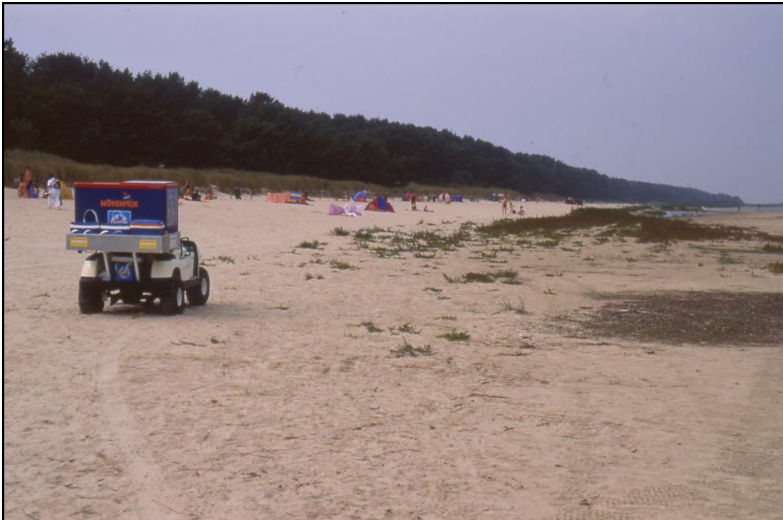
Abb. 4: Spülsaumvegetation auf Usedom, nördlich Karlshagen (im Vordergrund durch Tritt zerstörter Spülsaum mit „fahrbarem Imbissstand“)