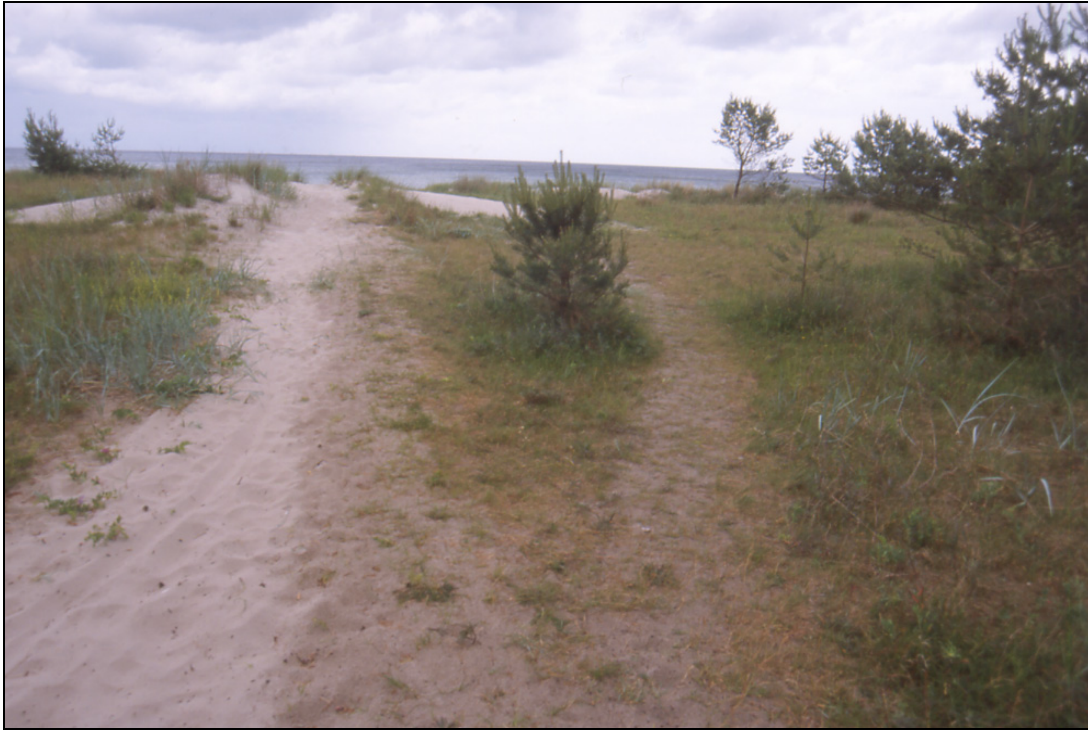
Abb. 3: Übergang „Prora – Nord“ (keine Abzäunung, aber aufgrund der schlechten Erreichbarkeit deutlich weniger Trittschäden, starke natürliche Sandakkumulation im Hintergrund)